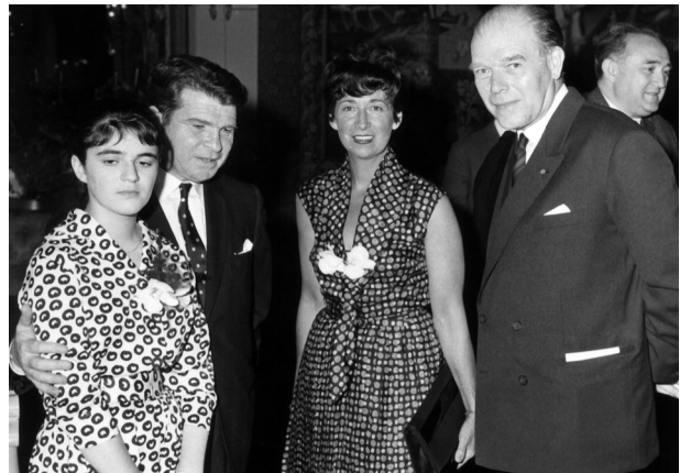
with his wife, Elena & Emil Gilels